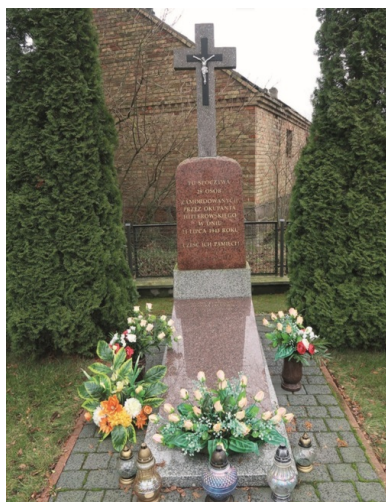
Pomnik wzniesiony na zbiorowym grobie ofiar pacyfikacji Wnor-Wand.

Przyczyną pacyfikacji Wnor-Wand były zapewne dwa wydarzenia. Jakiś czas przed 21 lipca w lesie koło wsi żołnierze podziemia zatrzymali pięcioosobową grupę niemieckich cywilów (zapewne urzędników), których po przeszukaniu puścili wolno. Ponadto w Kuleszach Kościelnych (być może 20 lipca) grupa egzekucyjna wykonała wyrok na miejscowym komisarzu rolnym, który wcześniej publicznie określał mieszkańców Wnor-Wand mianem bandytów. Pewne jest, że gospodarze tej wsi spodziewali się odwetu (być może zostali też ostrzeżeni) i podjęli kroki mające zabezpieczyć ich najbliższych – niektórzy odesłali kobiety i dzieci do rodzin w innych miejscowościach, niemal wszyscy zaś spali poza domem: na wozach czy stogach siana, niejako na czatach, mając nadzieję, że pozwoli im to w porę ostrzec tych, którzy pozostali w domach.