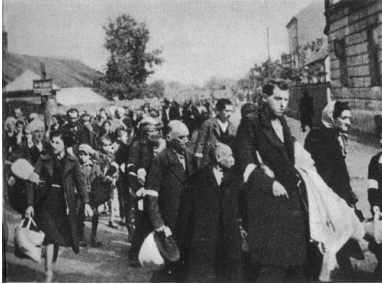
Deportacja Żydów rzeszowskich do obozu w Bełżcu, 1942 r. (domena publiczna)

wyłapywali ukrywające się osoby, a następnie eskortowali je na miejsce zbiórki. Zdarzało się, że część osób rozstrzelano na miejscu. Na placu zbiorczym dokonywano rewizji, a także selekcji. Niewielką grupę, ok. 200 osób, pozostawiono do porządkowania terenu getta.