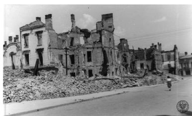
Zniszczenia wojenne w Jaśle, 1946 r.

Do getta jasielskiego trafili także Żydzi z okolicznych miejscowości, m.in. Frysztaka, Jedlicza i Kołaczyc. Pewna grupa Żydów trafiła też do niemieckiego obozu pracy w Szebniach. Według niektórych źródeł getto utworzono już w drugiej połowie 1941 r. – miało ono wówczas charakter otwarty. Założono je w okolicach dawnego placu targowego, powszechnie nazywanego „targowicą”. Była to raczej uboższa część miasta, o słabej infrastrukturze. Na relatywnie niewielkim obszarze, skomasowano ok. 3 tys. osób, co dodatkowo pogarszało i tak trudne warunki egzystencji. Po zamknięciu bram getta, kiedy dzielnicę tę można było opuścić za specjalnym pozwoleniem, warunki te uległy dalszej degradacji. Szerzyły się głód i choroby.