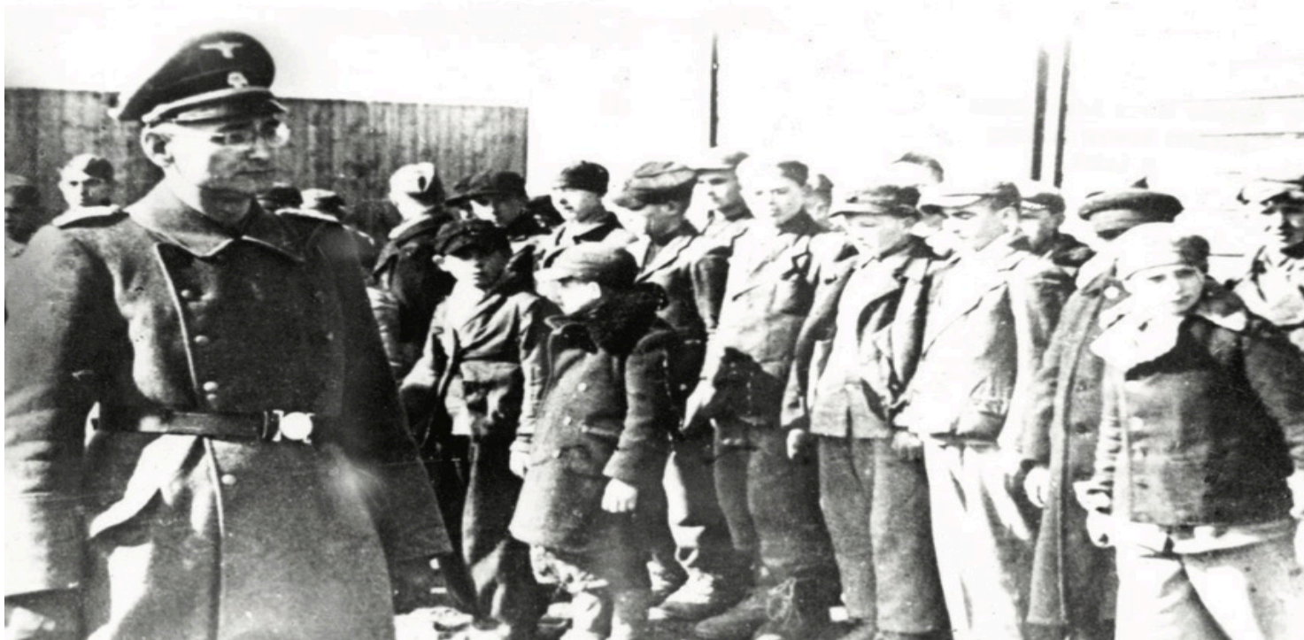
Dzieci wizytowane podczas pracy

https://przystanekhistoria.pl/pa2/tematy/okupacja-niemiecka/96118,Oboz-przy-Przemyslowej-w-Lodzi-pieklo-dla-najmlodszych.html