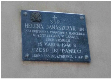
Tablica pamiątkowa na ścianie kościoła Matki Boskiej Zwycięskiej w Łodzi