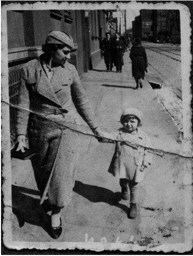
Helena Janaszczyk