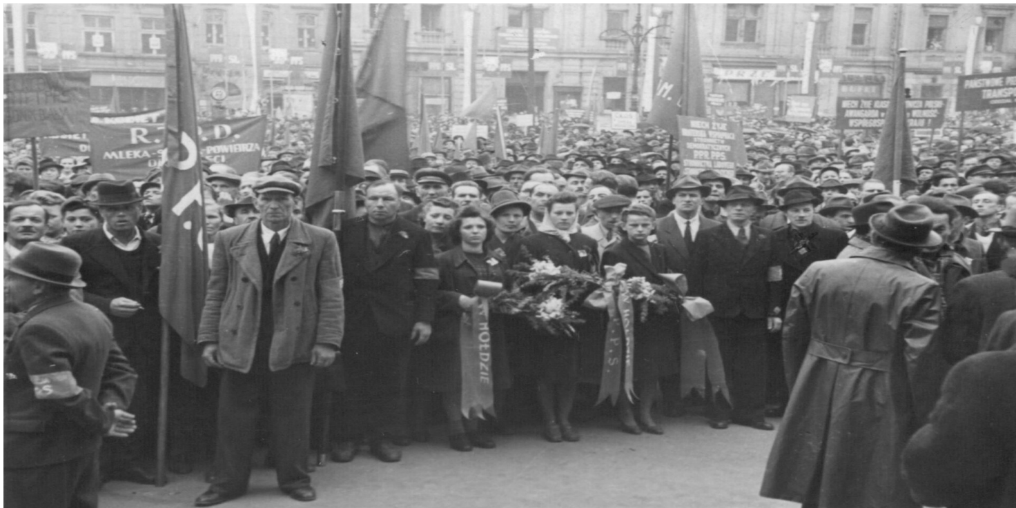
Wiec poparcia na Ryнку Głównym w Krakowie w sprawie zbliżającego się referendum, 28 czerwca 1946 r.

https://przystanekhistoria.pl/pa2/tematy/okupacja-sowiecka/101905,Referendum-w-cieniu-sowieckich-bagnetow.html