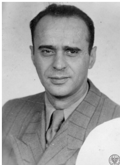
Józef Różański (wł. Józef Goldberg), jeden z szefów pionu śledczego MBP, kolaborant sowiecki i zbrodniarz stalinowski.