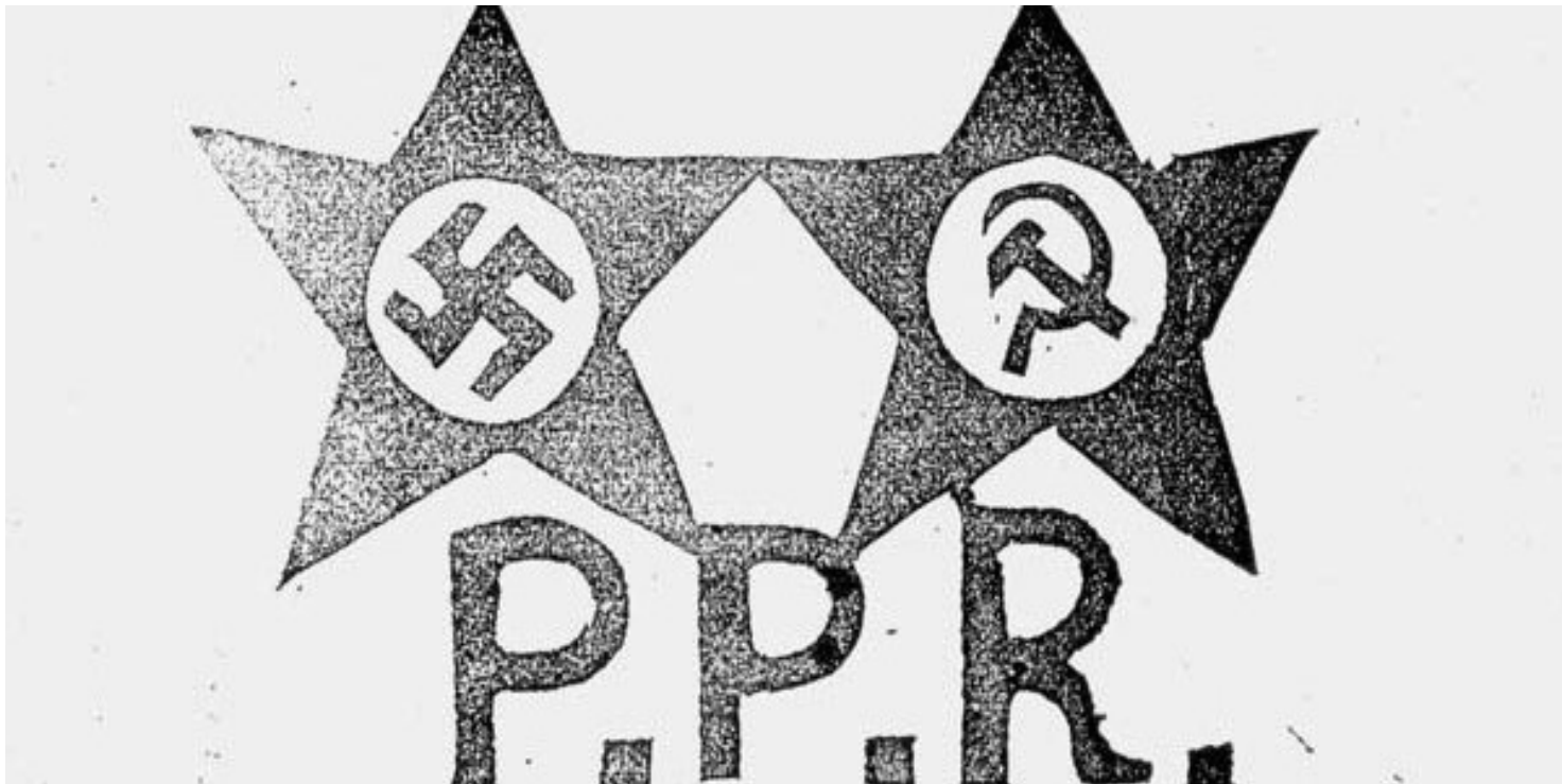
Ulotka Zrzeszenia "Wolność i Niezawisłość".

https://przystanekhistoria.pl/pa2/tematy/okupacja-sowiecka/63162,Sledztwo-i-proces-I-Zarzadu-Glownego-WiN.html