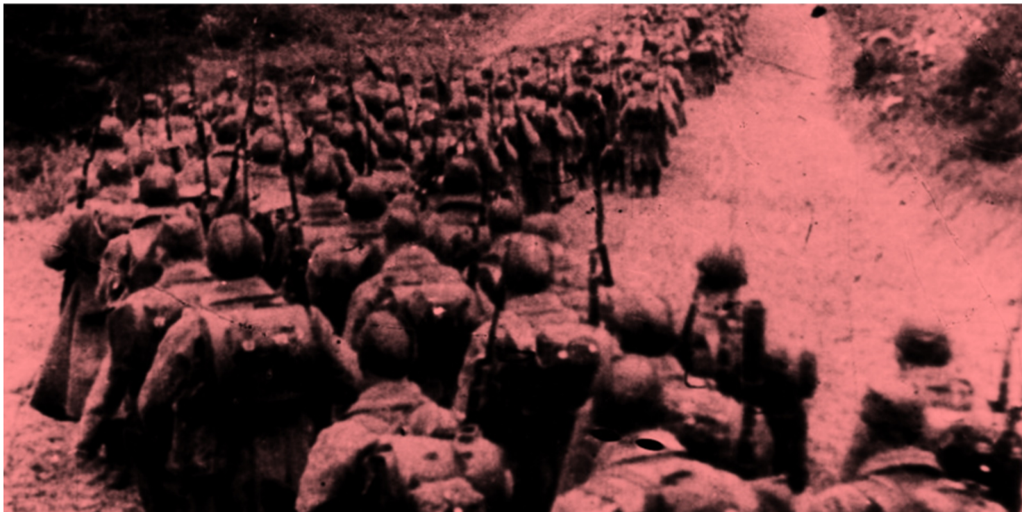
Kolumny piechoty sowieckiej wkraczające do Polski 17 września 1939

https://przystanekhistoria.pl/pa2/tematy/okupacja-sowiecka/67152,Kresy-Wschodnie-19401941-Branka-do-Armii-Czerwonej.html