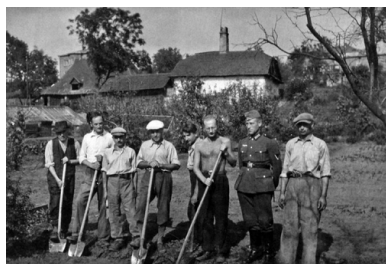
Ryszard Siwiec jako pracownik fizyczny przy pielęgnacji zieleni miejskiej w Przemyślu, lata 1940-1941

Natomiast Gomułka nie chciał kontynuować rozpoczętego przemówienia, ale zaczęła grać orkiestra, a na stadionie pojawiły się barwne korowody w strojach ludowych rozpoczynając tym samym część artystyczną. Jednak gdzieś tam na trybunach rozgrywał się osobisty dramat człowieka, który chciał, aby usłyszano jego krzyk rozpaczny. W asyście funkcjonariuszy siłą został doprowadzony do karetki pogotowia. Radosny charakter uroczystości państwowej już tego dnia nie zagościł na twarzach zebranego tłumu. Straciła też na blasku dożynkowa uroczystość.