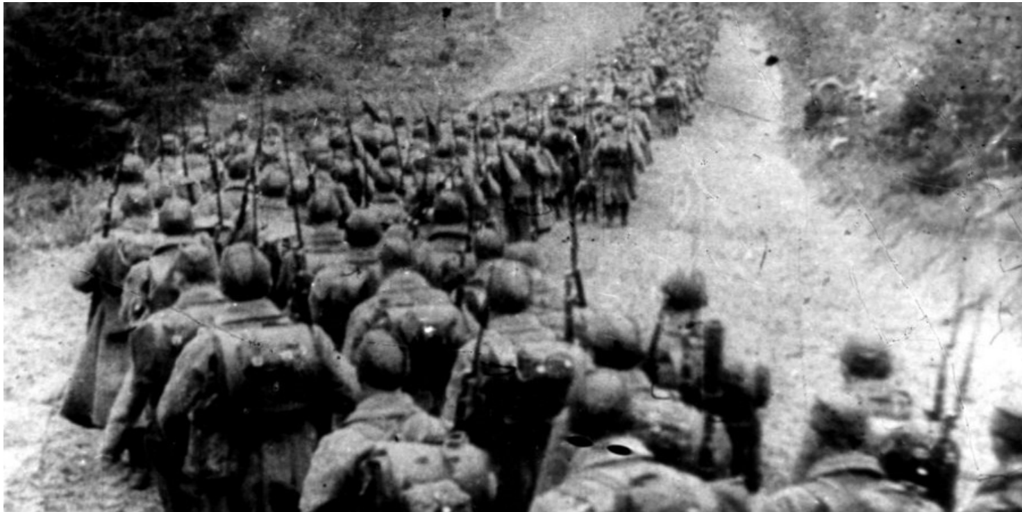
Kolumny piechoty sowieckiej wkraczające do Polski, 17 września 1939 r.

https://przystanekhistoria.pl/pa2/tematy/okupacja-sowiecka/86207,Sowieckie-zbrodnie-i-represje-wobec-obywateli-polskich-po-17-wrzesnia-1939-roku.html