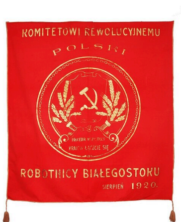
Sztandar Tymczasowego Komitetu Rewolucyjnego Polski z 1920 r.

Nowe władze sowieckie nie chciały współpracować z polskimi komunistami, gdyż w 1938 r. Międzynarodówka Komunistyczna rozwiązała Komunistyczną Partię Polski. Oficjalnym powodem tej decyzji było przekonanie, że nastąpiło przejście kontroli nad strukturami partii przez polskie służby bezpieczeństwa. Fikcyjnych dowodów dostarczyli funkcjonariusze partyjni zamordowani na fali czystek, które pochłonęły kierownictwo KPP w latach wcześniejszych. Jednak był to tylko pretekst, który miał pomóc Stalinowi w pozbyciu się starych, zasłużonych działaczy, pamiętających czasy Lenina i rewolucji bolszewickiej.