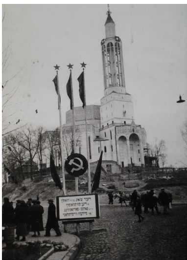
Kościół św. Rocha w Białymstoku

Pozycja i znaczenie polskich komunistów w oczach władz sowieckich poprawiły się latem 1940 r. Władze sowieckie wycofały się wtedy z przyznawania polskim działaczom komunistycznym tzw. paszportów z paragrafem 11, część działaczy objęła kierownicze stanowiska, zaczęła wychodzić polskojęzyczna prasa, w której zatrudnienie znalazło szereg polskich byłych funkcjonariuszy KPP.