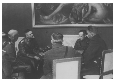
Spotkanie niemieckich i sowieckich oficerów w gmachu dotychczasowego urzędu wojewódzkiego w Białymstoku, 1939 r.

„Związek Radziecki cieszył się naszą sympatią i w nim widzieliśmy nasze nadzieje”.