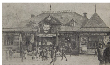
Dom Ludowy w Dzierżyńsku w 1932 r. ozdobiony portretem Feliksa Dzierżyńskiego i szyldem w języku polskim. Do 1932 r.

W dwóch autonomiach – Polskim Rejonie Narodowym im. Juliana Marchlewskiego (Marchlewszczyźnie) powstałym w 1925 r. na sowieckiej Ukrainie oraz Polskim Rejonie Narodowym im. Feliksa Dzierżyńskiego (Dzierżyńszczyźnie) powołanym do życia w 1932 r. na terytorium Białoruskiej SRS – tworzono polskie rady wiejskie, przedszkola, szkoły, technika pedagogiczne, domy dziecka, sądy, instytucje kultury i oświaty. Na sowieckiej Białorusi język polski uzyskał – obok białoruskiego, rosyjskiego i jidysz – status języka państwowego. Bolszewicy traktowali polskie autonomie jako swego rodzaju model mający służyć do przetestowania pewnych rozwiązań przed przeniesieniem ich do podbitej w przyszłości Polski.