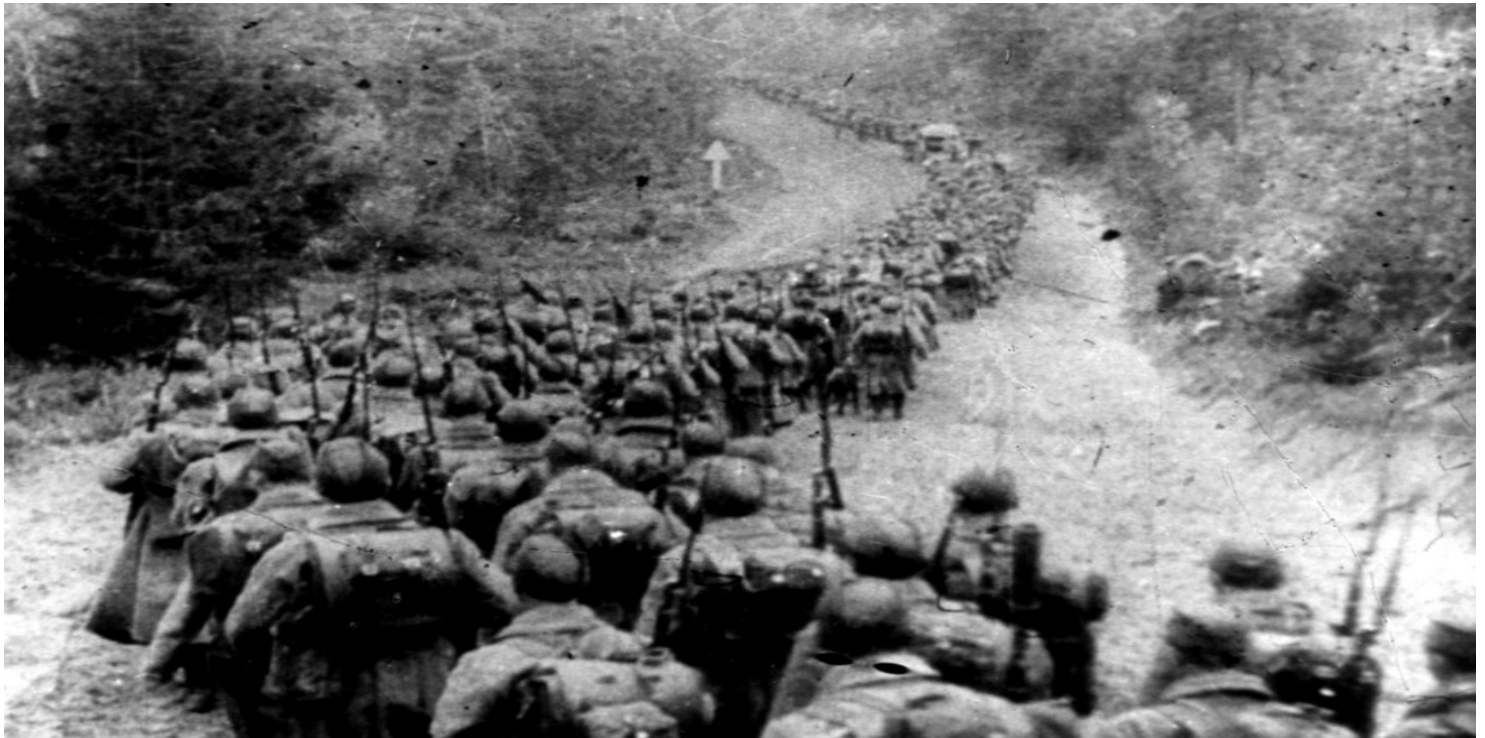
Oddziały sowieckie wkraczające do Polski 17 września 1939 r.

https://przystanekhistoria.pl/pa2/tematy/okupacja-sowiecka/87517,Kwestia-polska-na-sowieckiej-Bialorusi.html