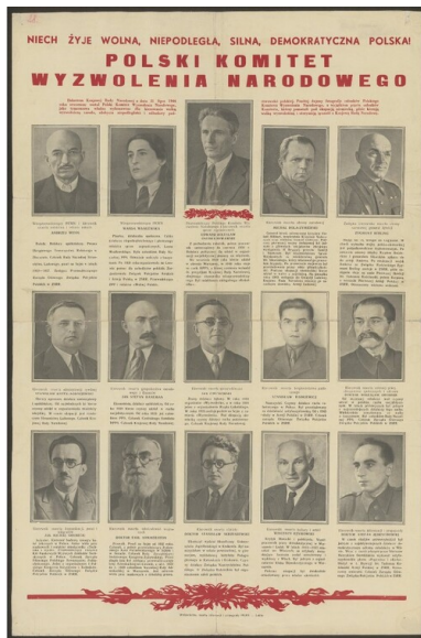
Skład Polskiego Komitetu Wyzwolenia Narodowego. Afisz Wydawnictwa Resortu Informacji i Propagandy PKWN z 1944 r.

22 lipca 1944 r. radio moskiewskie wraz z komunikatem o powstaniu PKWN ogłosiło „Manifest PKWN do narodu polskiego”. Wzywał on Polaków do współpracy z Armią Czerwoną