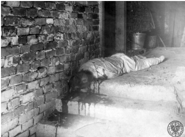
Zwłoki Józefa Hachlicy, prezesa Koła PSL w Krakowie-Prokocimiu, zamordowanego 22 października 1946 r. przed drzwiami własnego domu

„Demokracja ludowa” była parawanem faktycznych przemian w kierunku państwa totalitarnego. Używając go, komuniści chcieli znieczulić Polaków i inne społeczeństwa Europy Środkowo-Wschodniej, w dużej części dążące do autentycznych reform społecznych, tak aby wprowadzenie „socjalizmu” w wersji sowieckiej przebiegło gładko. Oficjalna ideologia, opierająca się na sile i kłamstwie, tworzyła sztuczny, pseudonaukowy świat, zgodny z rosyjskim podwójnym myśleniem, dopuszczającym sprzeczności logiczne. „Demokracja”