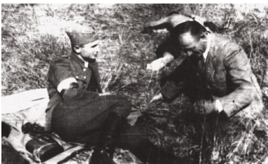
„Warszyc” podczas koncentracji

„W imieniu Oficerów, Podoficerów i Szeregowców, wiernych ideologii AK”.