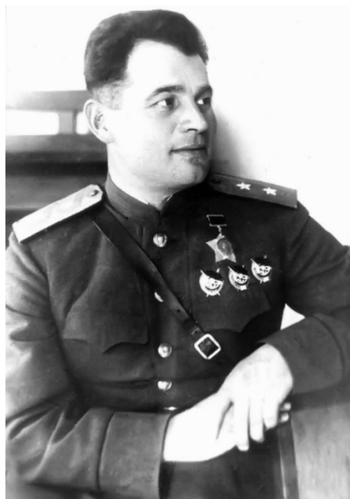
Iwan Czerniachowski, 1943