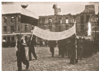
Pisz w 1946 r. Pochód pierwszomajowy na tle miejskich ruin.

Począwszy od 1945 r., w całym kraju nadawano ulicom nazwy inspirowane przez postacie i wydarzenia z historii polskiego i międzynarodowego komunizmu. W poszukiwaniu odpowiednich patronów odwoływano się także do sowieckich bohaterów czasu rewolucji, sowieckich przywódców partyjnych i państwowych oraz okresu „wyzwalania”. Niekiedy powstawały całe systemy ulic, które miały tworzyć semantyczną całość z nazwami naznaczonymi komunistyczną faktografią czy ideologią, np.: ul. Wyzwolenia – pl. Wolności – ul. 22 Lipca – al. Zwycięstwa – ul. 1 Maja (Olsztyn); pl. Dzierżyńskiego – ul. Stalingradzka – al. 1 Maja (Pisz). Tylko część z tych nazw przetrwała próbę czasu i zmianę ustroju na przełomie lat osiemdziesiątych i dziewięćdziesiątych ubiegłego wieku, głównie dzięki zastosowaniu bardziej uniwersalnego zinterpretowania (ul. Wyzwolenia, Partyzantów).