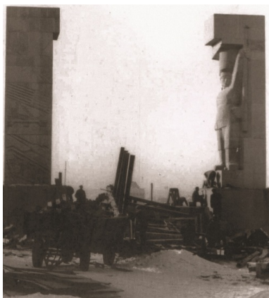
Budowa Pomnika wdzięczności Armii Czerwonej.

W rzeczywistości decyzje o budowie zapadły na dużo wyższym szczeblu, a tylko formalną inicjatywę pozostawiono środowisku lokalnemu, aby stworzyć pozory demokracji i oddolnej potrzeby upamiętnienia Armii Czerwonej oraz wyrażenia wdzięczności za „wyzwolenie”. Na czerwcowym zjeździe TPPR obok kwestii pomnika wspomniano oczywiście o korzyściach płynących ze współpracy ze Związkiem Sowieckim, o wiecznej przyjaźni obu państw i o wdzięczności za wyzwolenie Olsztyna.