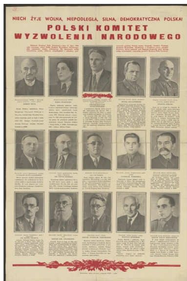
Skład Polskiego Komitetu Wyzwolenia Narodowego. Afisz Wydawnictwa Resortu Informacji i Propagandy PKWN z 1944 r.

Witos, Stanisław Kotek-Agroszewski czy, nieco później, Bolesław Drobner) byli eliminowani z kierownictw tych ugrupowań. Niekiedy motywy przejścia na stronę komunistów były bardziej złożone. Organizatorem na przykład współpracującego z nową władzą ugrupowania, mającego obejmować katolików, został Bolesław Piasecki, założyciel ONR-Falangi, znany ze zdecydowanego, wręcz skrajnie antykomunistycznego nastawienia.