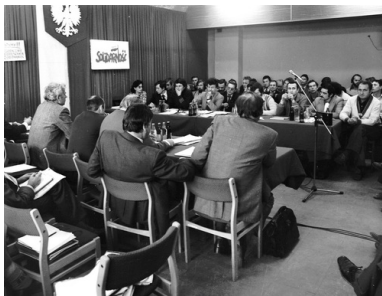
Negocjacje Komisji Rządowej z Międzyzakładowym Komitetem Założycielskim NSZZ „Solidarność” z siedzibą w Hucie „Katowice”, Dąbrowa Górnicza, październik 1980 r. Autor nieznany. Fot. ze zbiorów Międzyzakładowej Organizacji