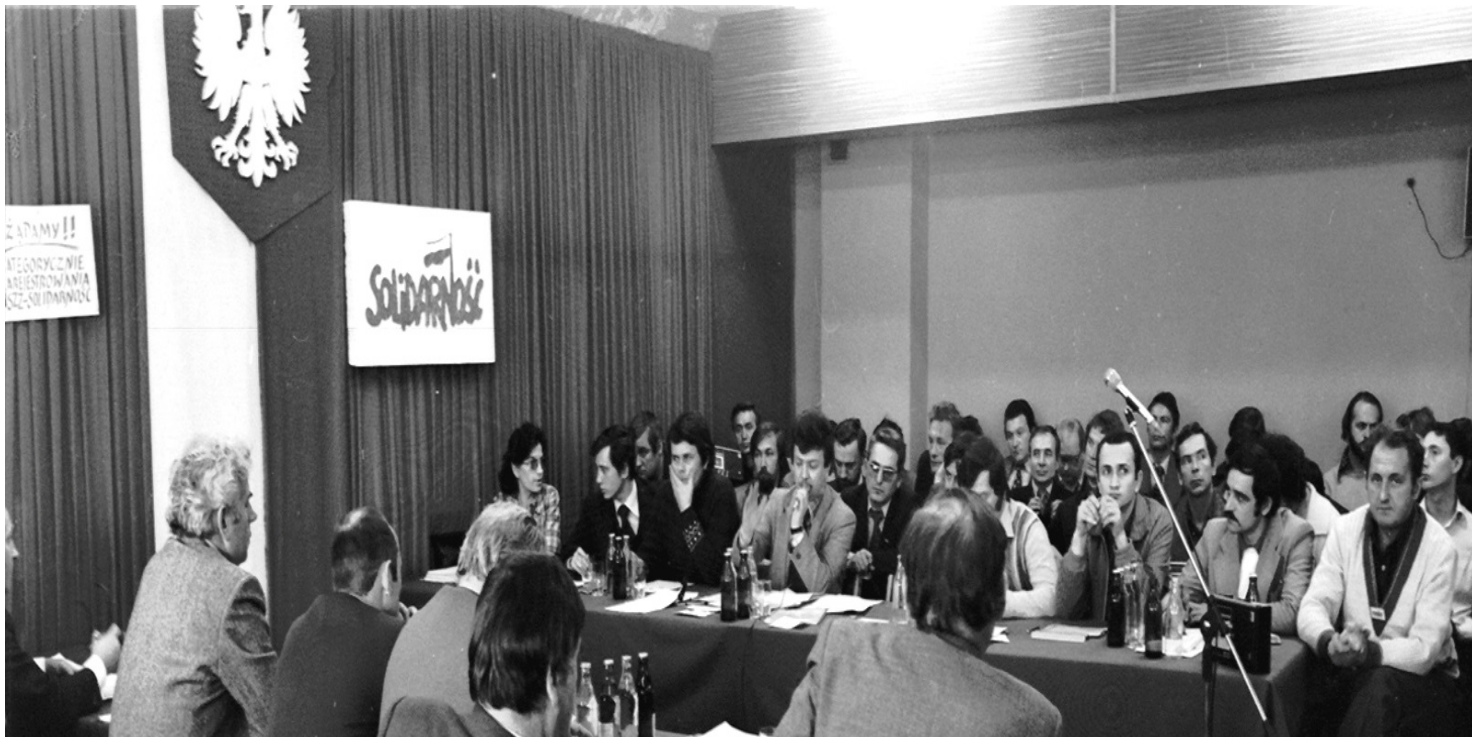
Fot. Międzyzakładowa Organizacja Związkowa NSZZ „Solidarność” ArcelorMittal Poland S.A. - Dąbrowa Górnicza

https://przystanekhistoria.pl/pa2/tematy/opozycja-w-prl/23008,Odmieniony-region-robotnicy-województwa-katowickiego-buntuja-sie-przeciw-systemowi.html