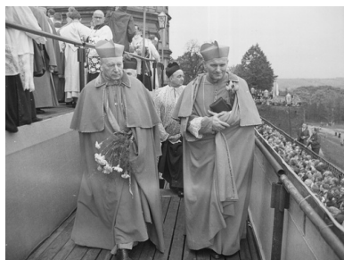
Prymas Stefan Wyszyński i Arcybiskup Karol Wojtyła na wałach klasztoru na Jasnej Górze w czasie uroczystości millenijnych