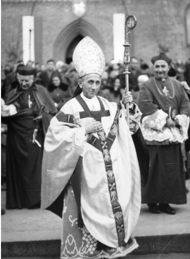
Arcybiskup poznański Antoni Baraniak i prymas Stefan Wyszyński podczas uroczystości z okazji 400-lecia założenia Seminarium Duchownego w Braniewie