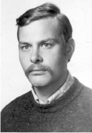
Stefan K. Kozłowski.