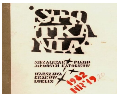
„Spotkania. Niezależne pismo młodych katolików”; nr 19 z roku 1982