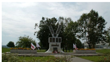
Pomnik Solidarności na pl. Centralnym w Nowej Hucie.

turze, co zmniejszało liczbę mandatów w rękach komunistów. Ku oburzeniu nie tylko członków młodzieżowych organizacji antykomunistycznych, ale zapewne znacznej części głosujących, którzy mozolnie skreślali każde nazwisko z „listy krajowej”, decydenci Komitetu Obywatelskiego „Solidarność” zgodzili się na zmianę ordynacji wyborczej w trakcie wyborów. Dodatkowe wzburzenie wywołała informacja przekazana przez rzecznika rządu Jerzego Urbana, że kandydatem na stanowisko prezydenta będzie Wojciech Jaruzelski.