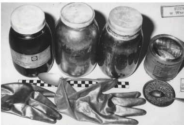
Materiały dowodowe znalezione