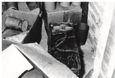
Urządzenia miotające ulotki. Fot.