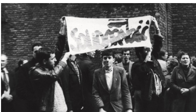
Demonstracja Solidarności przed katedrą św. Jana w Warszawie, 1 maja 1984 r.