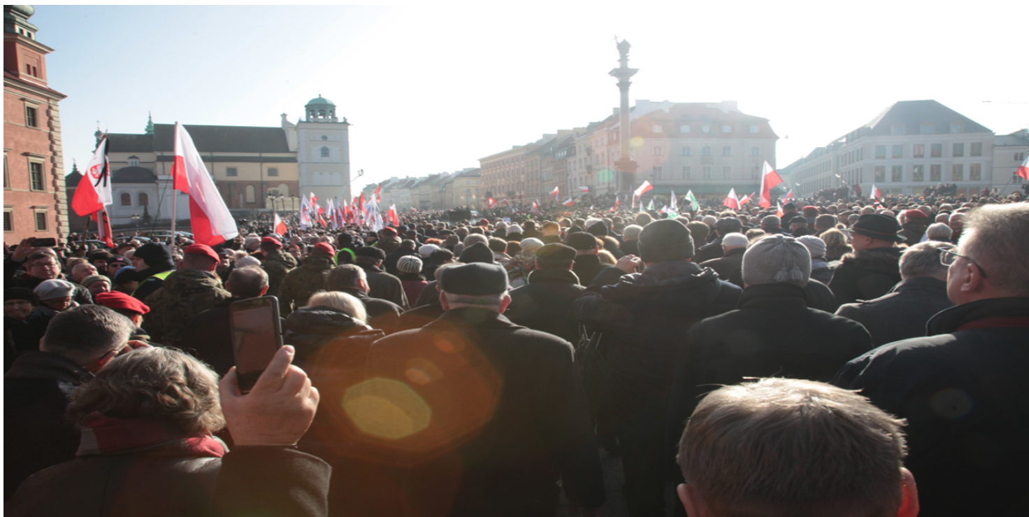
Warszawa, Polacy żegnają Jana Olszewskiego. 16 lutego 2019.

https://przystanekhistoria.pl/pa2/tematy/opozycja-w-prl/78433,Jan-Olszewski-19302019.html