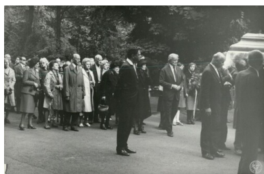
Jan Olszewski na pogrzebie Kazimierza Moczarskiego, październik 1975 r.