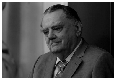
Jan Olszewski.

Po ogłoszeniu stanu wojennego pełnił funkcję doradcy w Sekretariacie Episkopatu Polski. Występował jako oskarżyciel posiłkowy w procesie morderców ks. Jerzego Popiełuszki. W 1988 r. współtworzył Komitet Obywatelski przy Przewodniczącym NSZZ „Solidarność” Lechu Wałęsie. Opowiadał się przeciwko dążeniu do porozumienia z komunistami. Odmówił objęcia z ramienia tzw. strony społecznej stanowiska przewodniczącego „podstolika” do spraw reformy prawa i sądów przy „okrągłym stole”.