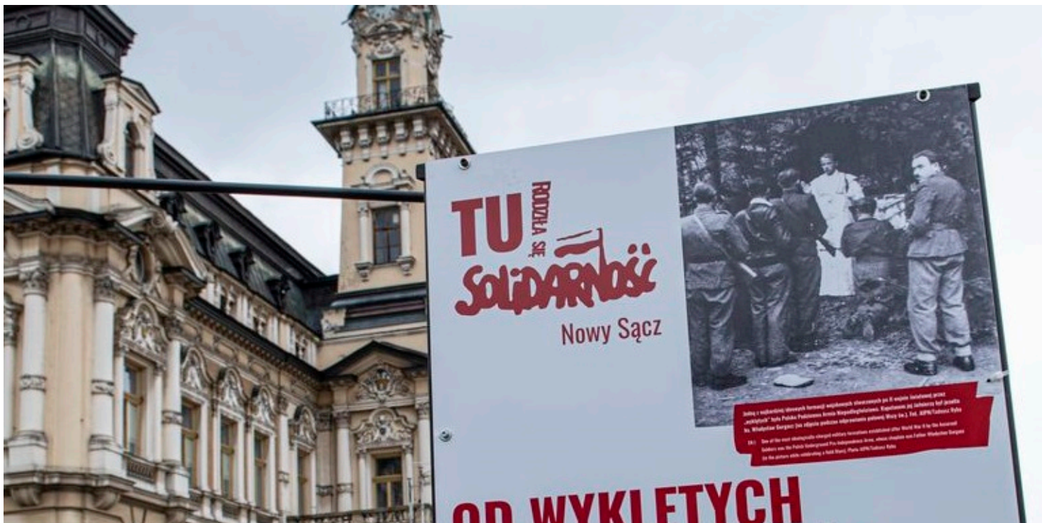
Wystawa „TU rodziła się Solidarność” w Nowym Sączu

https://przystanekhistoria.pl/pa2/tematy/opozycja-w-prl/80098,Poczatki-niezaleznego-ruchu-zwiazkowego-w-Gorlicach.html