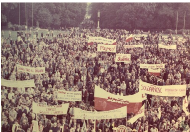
Pielgrzymki ludzi pracy do Częstochowy w latach 80. XX w. (tu: 1984). Tłum wiernych na błoniach klasztoru OO. Paulinów na Jasnej Górze.