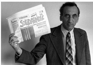
Tadeusz Mazowiecki

Atmosfera panująca w barze zaczynała przypominać ostatnie chwile rejsu „Titanica”.