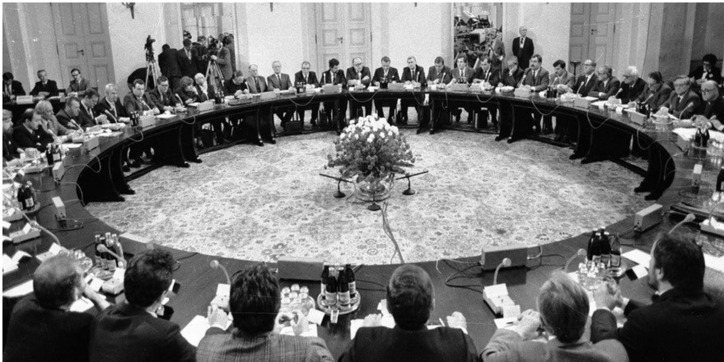
Obrady Okrągłego Stołu

https://przystanekhistoria.pl/pa2/tematy/opozycja-w-prl/92281,Okragly-Stol-oczami-Czeslaw-Milosza.html