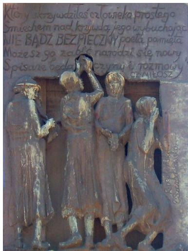
Tablica ze zdjęciem Czesława Miłosza na gdańskim Pomniku Poległych Stoczniovców 1970

francuskie o azyl polityczny. Od tego czasu tworzył na emigracji, m.in. demaskując oblicze polskiego komunizmu. Oczywiście interesował się sprawami polskimi, choć podczas wizyty w kraju w czerwcu 1981 r., podczas tzw. solidarnościowego karnawału, wyraźnie dystansował się od zdarzeń w ojczyźnie. Nie chciał się nawet na ich temat wypowiadać, jednak – jak się okazuje – do czasu.