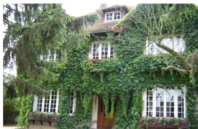
Siedziba Instytutu Literackiego w Maisons-Laffitte, 2006

Opinie wypowiedane przez czołowych przedstawicieli emigracji interesowały oczywiście peerelowskich przywódców. Pracowicie, więc zbierali je dla nich funkcjonariusze Służby Bezpieczeństwa. Tak było również w przypadku Czesława Miłosza, laureata literackiej Nagrody Nobla w 1980 r., a dla komunistów – zdrajcy.