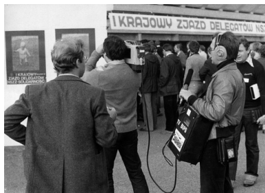
Operatorzy TV BIPS (Biuro Informacji Prasowej KKP NSZZ „S”) przed wejściem na halę widowiskowo-sportową "Olivia" w Gdańsku, gdzie odbywał się I Krajowy Zjazd Delegatów Niezależnego Samorządnego Związku Zawodowego "Solidarność", 1981 r.

Rosji, Białorusi, Ukrainie. Wytłumaczył mi wiele meandrów życia w ZSRS, przybliżył liczne wątki tamtejszych tradycji. Kiedyś powiedział mi, że z punktu widzenia »ludzi sowieckich« polski sprzeciw wobec komunizmu może być całkiem niezrozumiały. W polskich sklepach można było bowiem dostać artykuły u nich zupełnie nieznane. W zasadzie wszystkie standardy były w Polsce wyższe od ZSRS... Zakres swobód obywatelskich też był u nas nieporównywalny z realiami Sowietów. Zupełnie nieporównywalne były również formy ucisku. W Polsce, w gronie krewnych czy znajomych, wszędzie swobodnie można było wymieniać myśli. Na Wschodzie coś takiego mogło się wiązać z prawdziwym ryzykiem. Rozmawialiśmy też o perspektywach rozpadu Związku Sowieckiego. Wtedy właśnie pierwszy raz spotkałem się z poglądem, że jeśli dojdzie do rozkładu tego mocarstwa, to przyczyną będą kwestie narodowościowe” 1 .