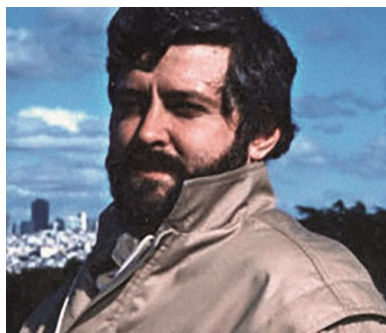
Andriy Fadin.

naprawienia sowieckiego komunizmu. Nie przeszkodziło to jednak śledczym KGB oskarżyć ich o próbę obalenia siłą ustroju sowieckiego. Jako pretekst dla podobnego oskarżenia wykorzystano plany stworzenia Związku Komunardów 4 . Był to pomysł Kudiukina, zafascynowanego ideologią wczesnych marksistów z XIX w. Związek ten miał być wzorowany na komunardach z Komuny Paryskiej. Idee walki z totalitaryzmem komunistycznym były dyskutowane na łamach wydawanych przez grupę nielegalnych czasopism samizdatu: „Warianty”, „Lewyj Poworot” [Zwrot na lewo], „Socjalizm i Buduszczeje” [Socjalizm i przyszłość], „Nowaja Nasza Niwa” (w języku białoruskim). W czasie śledztwa, przeprowadzonego po aresztowaniu większości młodych socjalistów w 1982 r., śledczym KGB udało się ustalić, że przepisali oni na maszynie do pisania i rozpowszechnili około stu egzemplarzy tych czasopism 5 , co na ówczesne warunki działalności dysydenckiej było rzeczą prawie niewiarygodną. Nielegalne publikacje w tym okresie rozpowszechniano przeważnie w pojedynczych egzemplarzach, głównie wśród zaufanych przyjaciół i kolegów.