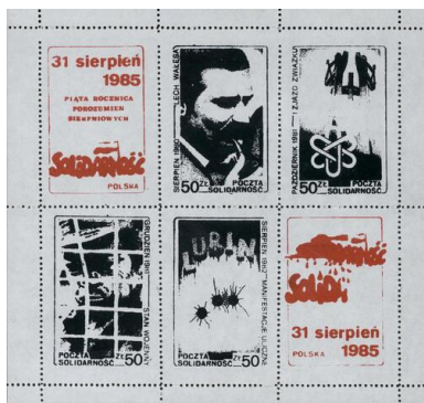
Seria znaczków upamiętniająca piątą rocznicę porozumień sierpniowych, wydana w 1985 r.