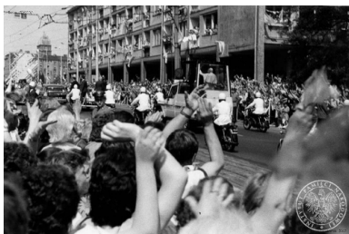
Jan Paweł II przejeżdża ulicami Szczecina pozdrawiany przez wiernych, 11 czerwca 1987 r.