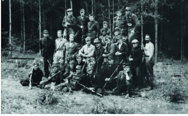
Oddział samoobrony na Wołyniu.

dochodziło do zabójstw pojedynczych osób, a czasem całych rodzin, głównie postaci wyróżniających się w swoim środowisku pozycją społeczną, pełnioną funkcją, autorytetem i potencjalnymi możliwościami organizowania polskiej konspiracji i obrony.