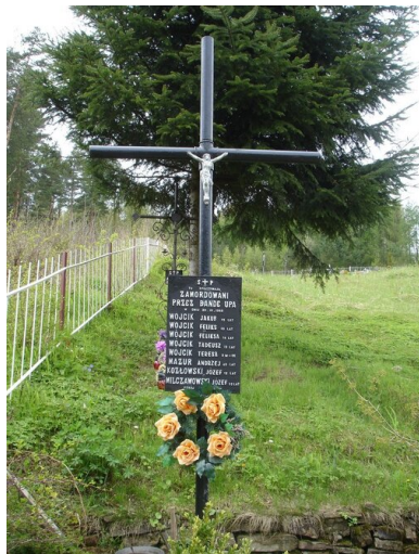
Zbiorowy grób rodziny Wójcików i ich sąsiadów ofiar napadu nacjonalistów ukraińskich z 20 IV 1945 r. Stan z 2012 r.

„Ostrowercha”, ranny został dowódca, który musiał się wycofać z pola walki. Na ten odcinek „Chrin” skierował swoje rezerwy. Po ciężkiej walce zdobyto leśniczówkę.