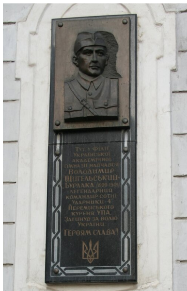
Tablica ukraińska poświęcona Włodzimierzowi Szczygelskiemu „Burface” - Lwów, ul. Piekarska 19 (obecna Ukraina).

Kobiet i dzieci nie mordowano, lecz upowcy straszili, że jak przyjdą następnym razem, to wszystkich „wyrzną nożami”. Mężczyzn, w tym osiemdziesięcioletnich starszków, mordowano bezlitośnie. Przeżyli jedynie ci, którzy się ukryli, lub udało się im uciec, mimo iż za nimi strzelano.