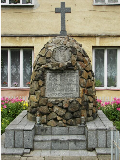
Obelisk ku czci pomordowanych 6 sierpnia 1944 r. w Baligrodzie.