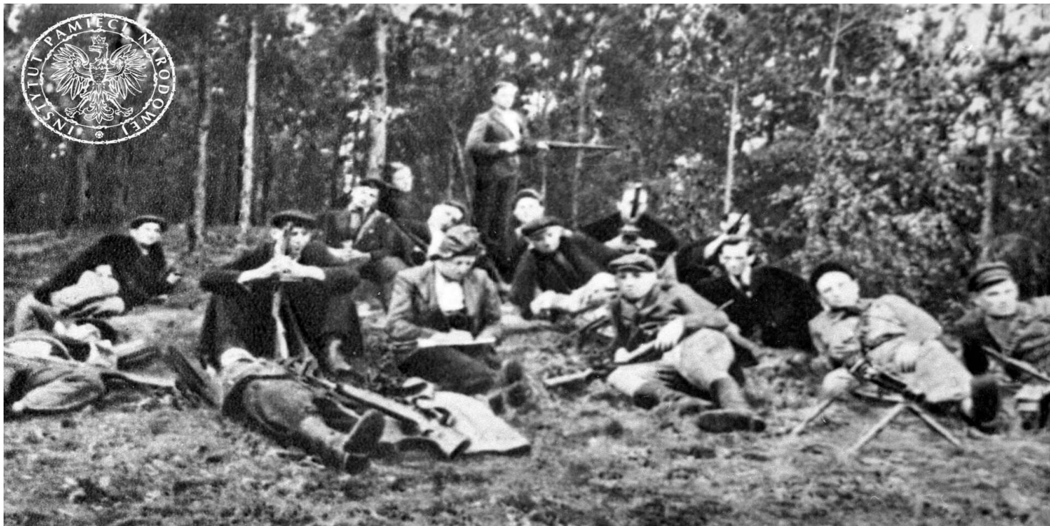
Grupa partyzantów Gwardii Ludowej podczas wypoczynku w lesie, 1942-1944

https://przystanekhistoria.pl/pa2/tematy/partia-omunistyczna/101433,Zbrojne-ramie-PPR-Akcje-bojowe-Gwardii-Ludowej.html