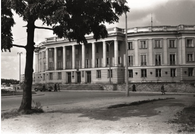
Gmach KW PZPR w Białymstoku.