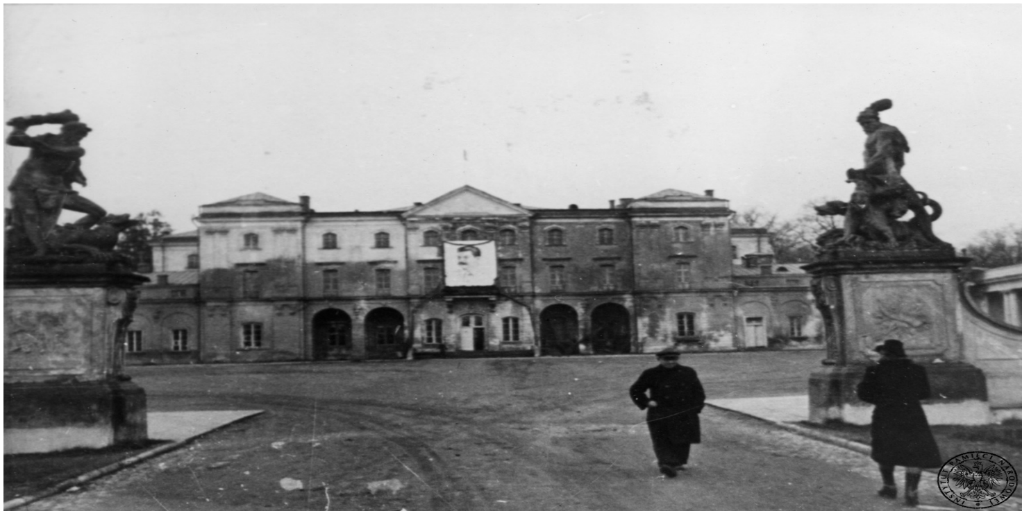
Portret Józefa Stalina na fasadzie pałacu Branickich w Białymstoku, 1939 r.

https://przystanekhistoria.pl/pa2/tematy/partia-omunistyczna/101850,Stalinowski-tandem-Dole-i-niedole-bialostockich-sekretarzy-KW-PZPR.html