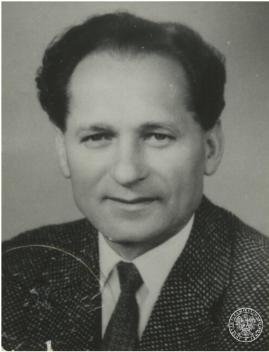
Mieczysław Moczar, Szef WUBP w Łodzi w latach 1945-1948.

Podczas gdy „partyzanci” swobodnie poszerzali swoje wpływy, na taką wyrozumiałość ze strony ekipy Gomułki nie mogły liczyć inne nurty w PZPR. W połowie 1963 r. z wysokich stanowisk partyjnych zrezygnował Roman Zambrowski, uznawany za przywódcę grupy „puławskiej”. Świadczyło to nie tylko o wzmagających się rządach silnej ręki, ale także o ostatecznej rozprawie z niedobitkami reformatorskiej grupy „puławian”. Kurs ten potwierdziło obradujące w tym czasie XIII Plenum KC PZPR, poświęcone sprawom ideologicznym. Uznaje się je za symboliczny, ostateczny kres procesu liberalizacji systemu w epoce Gomułki.