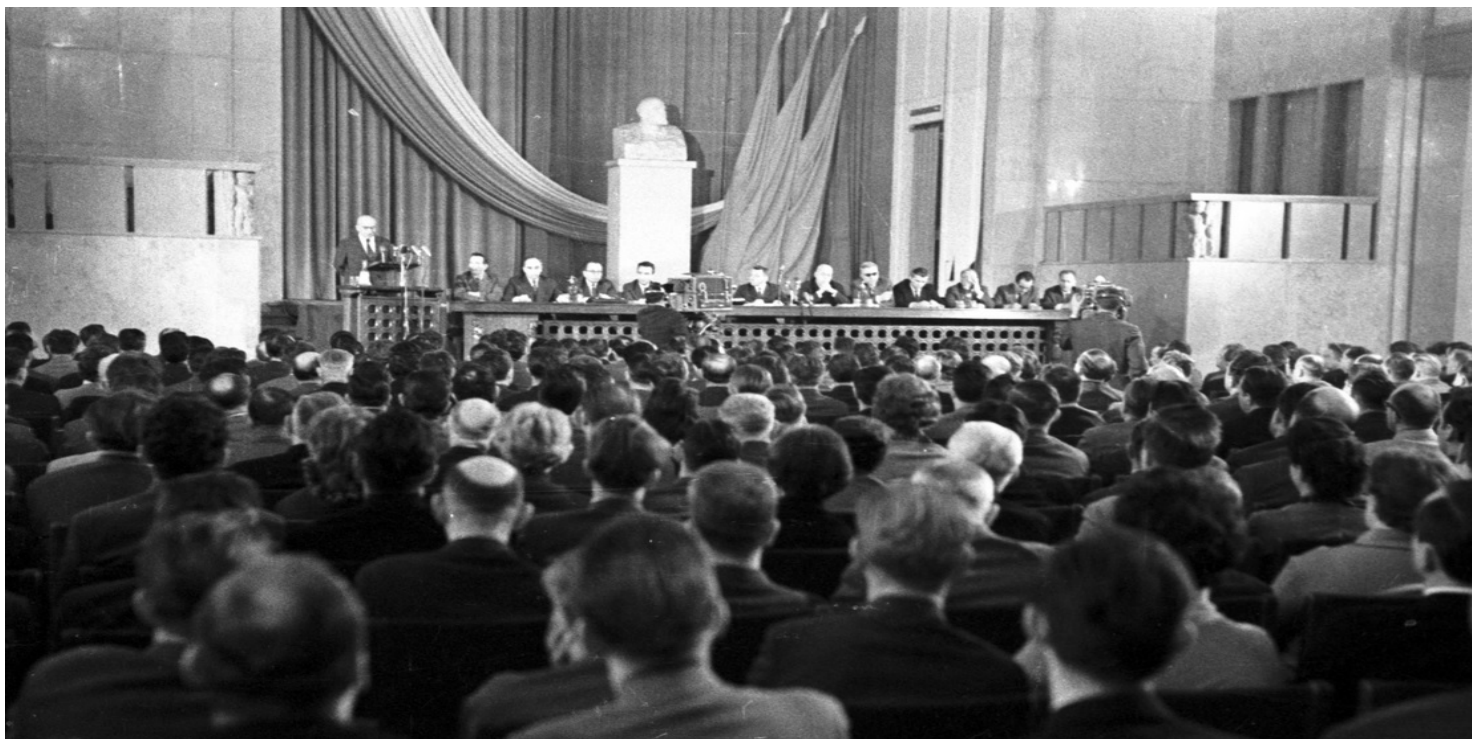
Spotkanie aktywu w Urzędzie Rady Ministrów. Z mównicy przemawia Władysław Gomułka.

https://przystanekhistoria.pl/pa2/tematy/partia-omunistyczna/101896,Stabilizacja-w-PZPR.html