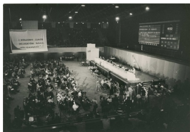
I Krajowy Zjazd Delegatów NSZZ „Solidarność” w Gdańskiej Hali Olivia

skonstruować przyszłościowy, strategiczny plan działania. Powszechnie sądzono, że moment taki nadejdzie w trakcie pierwszego zjazdu NSZZ „Solidarność”, na którym po raz pierwszy w czasach PRL delegaci wyłonieni zostali przy pełnym przestrzeganiu demokratycznych procedur. Zjazd musiał też przynieść odpowiedź na zasadnicze, niezwykle doniosłe pytanie: czy „Solidarność” pozostaje w ramach czysto związkowych, czy też akceptuje oficjalnie publicznie pełnioną rolę ruchu społecznego.