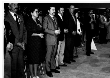
I Krajowy Zjazd Delegatów NSZZ „Solidarność” w Gdańskiej Hali Olivia