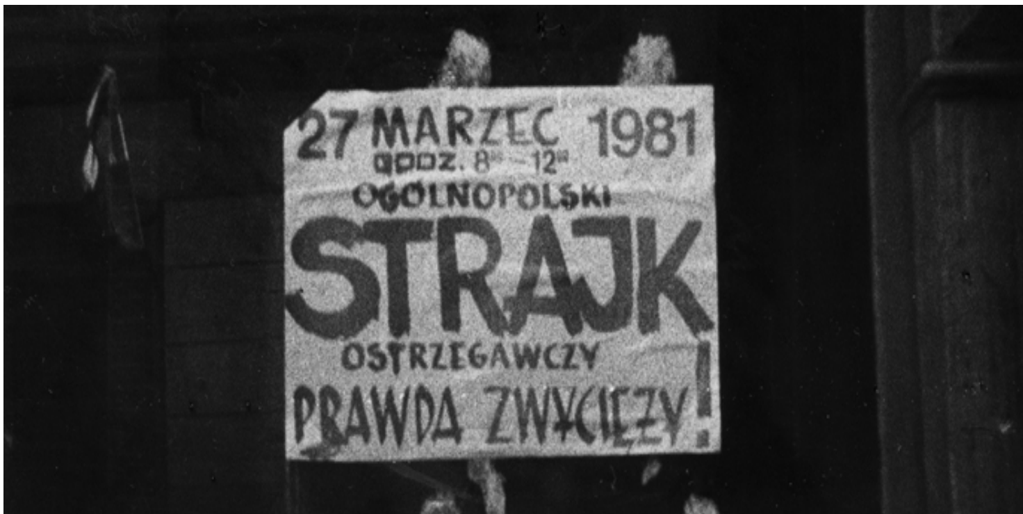
Plakat z marca 1981 r.

https://przystanekhistoria.pl/pa2/tematy/partia-omunistyczna/103387,Droga-do-konfrontacji.html