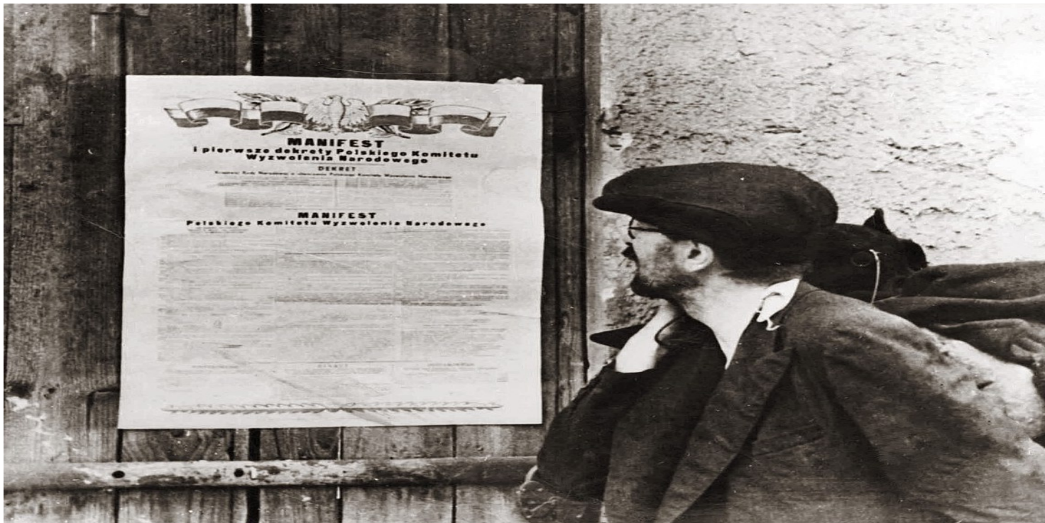
Zdjęcie czytającego plakat manifestu PKWN (domena publiczna)

https://przystanekhistoria.pl/pa2/tematy/partia-omunistyczna/105265,Czas-stalinowskiej-nocy-Zniewalanie.html