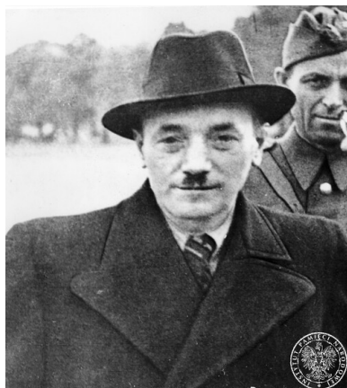
Bolesław Bierut.

Był on zresztą typowym figurantem. W gabinecie tym o wiele więcej do powiedzenia miał odpowiadający za przemysł Hilary Minc, niezmiennie zawiadujący „bezpieczeństwem” Radkiewicz czy zaledwie podsekretarz stanu w Prezydium Rady Ministrów, Jakub Berman.