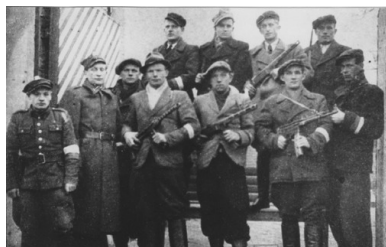
Funkcjonariusze PUBP i ORMO oddelegowani do zabezpieczenia referendum, 1946 r.

Miejscowe władze komunistyczne intensyfikowały ową akcję również pod wpływem nacisków ze strony Kremla. Świat ogarniała znów wojna, co prawda tylko „zimna”, jednak kraje położone za żelazną kurtyną, jak świadczyła o tym choćby reakcja na propozycje podjęcia programu odbudowy gospodarczej, przedstawionego przez George’a Marshalla latem 1947 r. (wstępnie zaakceptowały go Polska, Czechosłowacja i Jugosławia), nie były jeszcze, pomimo stałej presji Kremla, w pełni posłuszne wobec dyrektyw płynących z Moskwy. W tej sytuacji systemowa unifikacja musiała ulec przyspieszeniu.