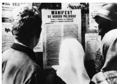
Propagandowa fotografia promująca utworzenie Polskiego Komitetu Wyzwolenia Narodowego i jego pierwsze