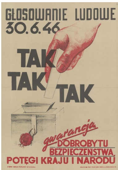
Plakat wzywający do głosowania 3 x Tak