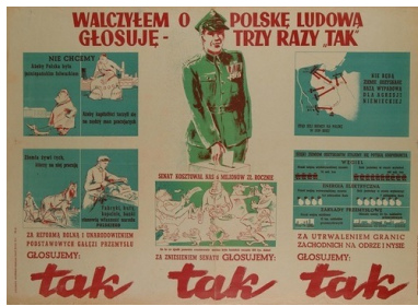
Przedreferendalna ulotka propagandowa