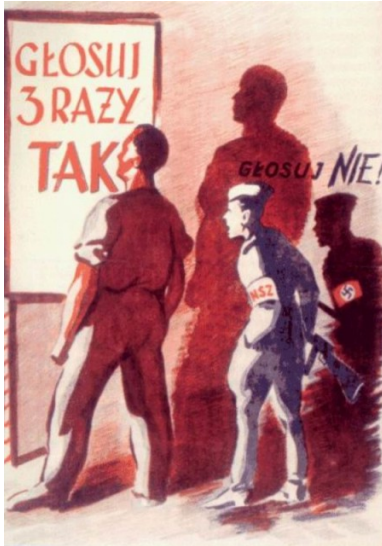
Plakat propagandowy z roku 1946 - referendum 3 x TAK. Za czytającym, żołnierz NSZ, przedstawiony jako kolaborant hitlerowski, namawiający do głosowania na NIE