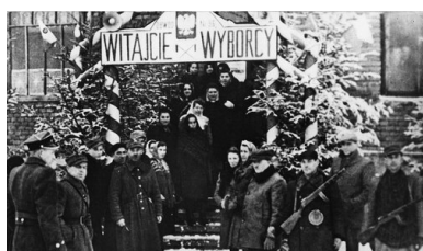
Wejście do lokalu wyborczego w Sanoku, 19 I 1947 r.

Według podanych oficjalnie do wiadomości wyników w wyborach wzięło udział blisko 90 proc. uprawnionych, spośród których na listę bloku zagłosować miało 80,1 proc., na PSL – 10,3 proc., na SP – 4,7 proc., na zorientowane na współpracę z komunistami grupy katolickie – 1,4 proc., a na PSL „Nowe Wyzwolenie” – 3,5 proc. W Sejmie Ustawodawczym znalazło się 114 przedstawicieli PPR i 116 PPS. SL uzyskało 109 mandatów, PSL – 27, PSL „Nowe Wyzwolenie” – 7, SD – 41, SP – 15, katolicy – 5, bezpartyjni – 10.