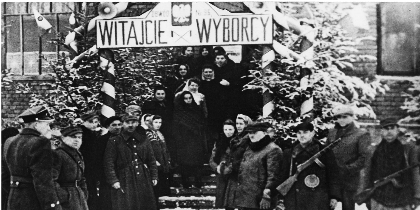
Wejście do lokalu wyborczego w Sanoku, 19 I 1947 r.

https://przystanekhistoria.pl/pa2/tematy/partia-omunistyczna/39304,Polacy-glosuja-PPR-decyduje.html