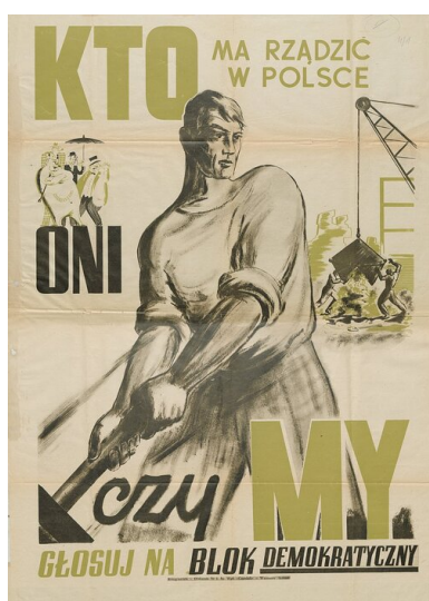
Plakat wyborczy tzw. Bloku Demokratycznego

Pułkownik miał się jeszcze sowieckiemu dyktatorowi przydać. Stalin planował bowiem przeprowadzenie nad Wisłą wyborów parlamentarnych (do czego zobowiązał się w Jałcie), które miały dowieść – w przekonaniu komunistów – słabości politycznej opozycji. W rzeczywistości chodziło o rozbitcie PSL Stanisława Mikołajczyka, a cel ten starano się osiągnąć wszystkimi możliwymi środkami.