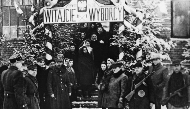
Wejście do lokalu wyborczego w Sanoku, 19 I 1947 r.

Według oficjalnych danych PPR i jej satelici uzyskali 80,1 proc. głosów przy zaledwie 10,3 proc. PSL-u. „Wybory to taka szkatułka: wchodzi Mikołajczyk – wychodzi Gomułka” – powtarzali ci, którzy nie mieli wątpliwości, co działo się 19 stycznia.