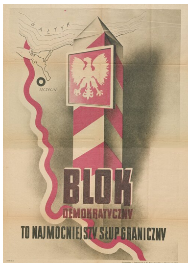
Plakat wyborczy tzw. Bloku Demokratycznego