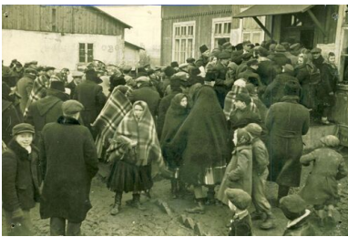
Mieszkańcy wsi przed lokalem wyborczym, 19 I 1947 r.