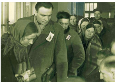
Kolejka w lokalu wyborczym, 19 I 1947 r.