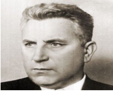
Edward Ochab (1906 - 1989)