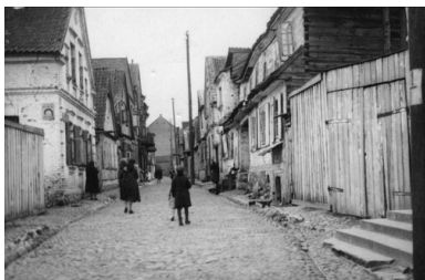
Białystok, ulica w dzielnicy Chanajki. Okres Drugiej Rzeczypospolitej.

Policja, idąc za ciosem, trzy dni po delegalizacji rady ponownie zwróciła się do Sądu Okręgowego, tym razem z wnioskiem o „zamknięcie” ośmiu najbardziej skomunizowanych związków.