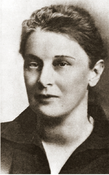
Maria (właśc. Marianna) Koszutska, pseud. Wera Kostrzewa (1876-1939)

Tym samym zgodzali się na ingerencję Kominternu w działalność partii. Poprzez zaaprobowanie w lutym 1921 roku tzw. „21 warunków”, które każda partia musiała podpisać chcąc zostać członkiem Kominternu, KPRP oficjalnie stała się częścią międzynarodowej struktury. Zaczęła też oficjalnie partycypować w budżecie Kominternu oraz wypełniać jego dyrektywy.