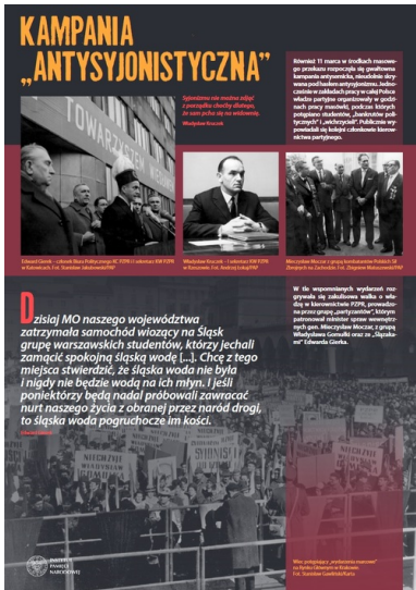
Plansza wystawy IPN Marzec'68