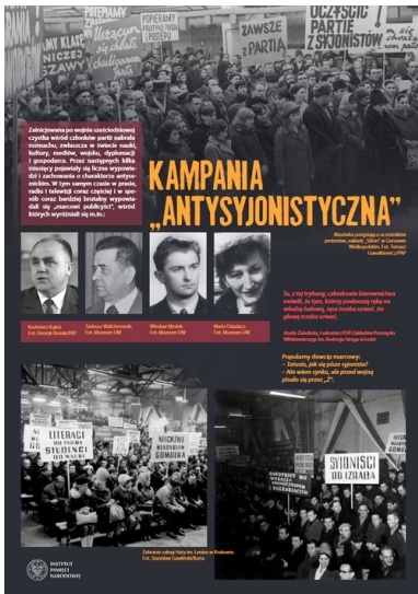
Plansza wystawy IPN Marzec'68