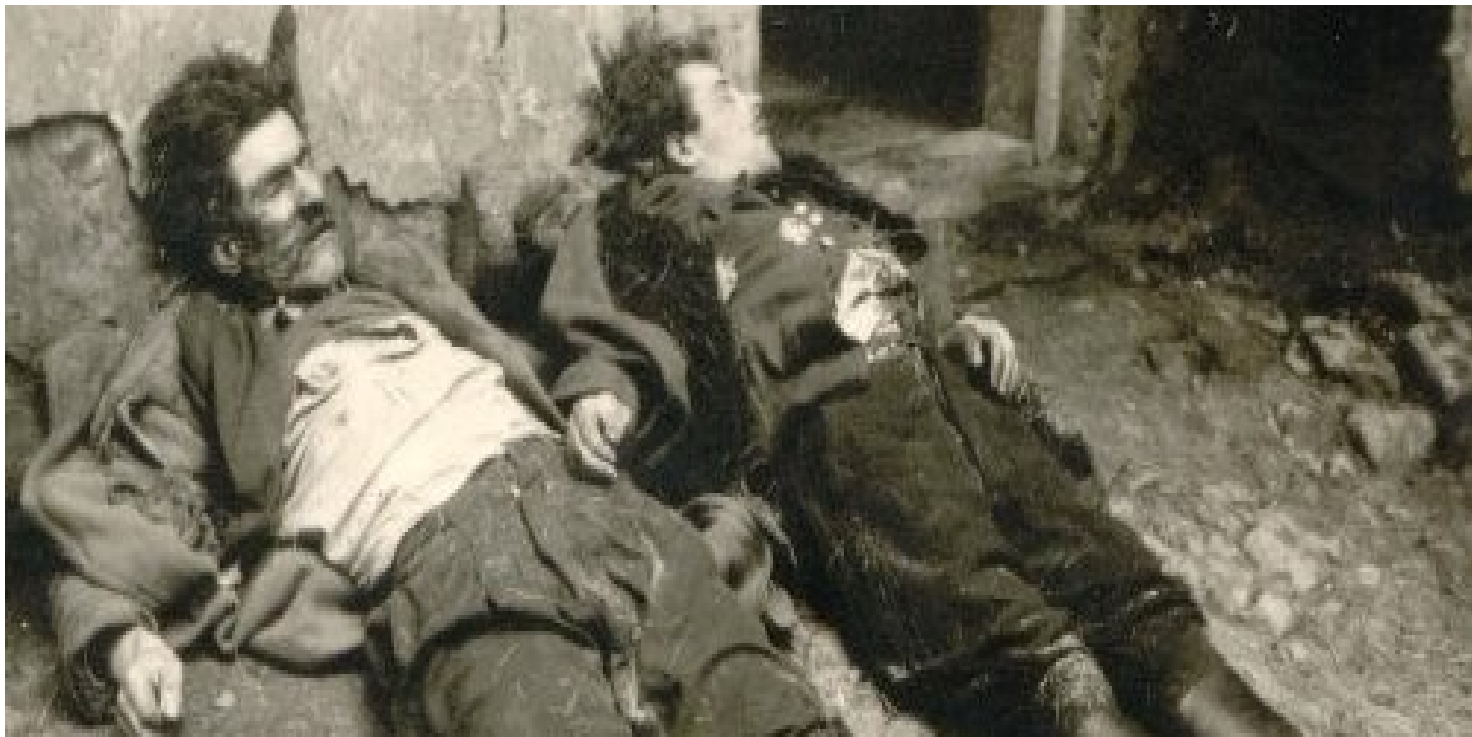
Fot. z zasobu IPN

https://przystanekhistoria.pl/pa2/tematy/partia-omunistyczna/81211,Kwestia-poparcia-spoiecznego-dla-komunistow-na-Rzeszowszczyznie-w-latach-1944194.html