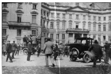
Starcia bojówki P.P.S. z robotnikami demonstrującymi pod sztandarami K.P.P. na Placu Teatralnym w Warszawie, 1 maja 1928 r.

Praca komisji programowej nad programem Kominternu trwała od 1922 r. W czerwcu 1923 r. na III Plenum Komitetu Wykonawczego Kominternu utworzono drugą komisję do spraw programu, której polecono zaangażować wszystkie sekcje Kominternu w celu omówienia i opracowania odpowiedniego projektu programu na następny kongres. Projekty programu były prezentowane na V Kongresie (czerwiec-lipiec 1924 r.), ale wówczas nie został on przyjęty. Powołano natomiast nową komisję, która miała kontynuować pracę nad przygotowaniem programu. Dopiero cztery lata później, 25 maja 1928 r., komisja opracowała dokument znany, jako „Projekt Programu”.