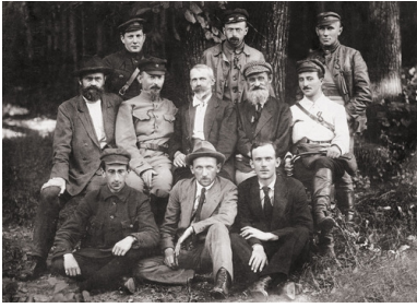
Tymczasowy Komitet Rewolucyjny Polski (Polrewkom), 1 sierpnia 1920 r., w środkowym rządzie drugi od lewej Feliks Dzierżyński, obok niego po prawej kolejno Julian Marchlewski i Feliks Kon.