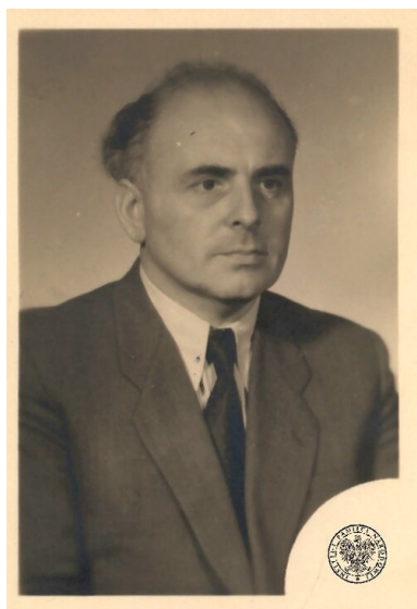
Jakub Berman. Zdjęcie z dokumentu z 1952 r.

Jednakże relacja Światły była uważana przez wielu historyków za przesadzoną lub też opartą na zasłyszanych plotkach. Toteż tematu do dziś nie zgłębiano.