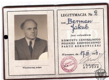
Legitymacja partyjna Bermana.