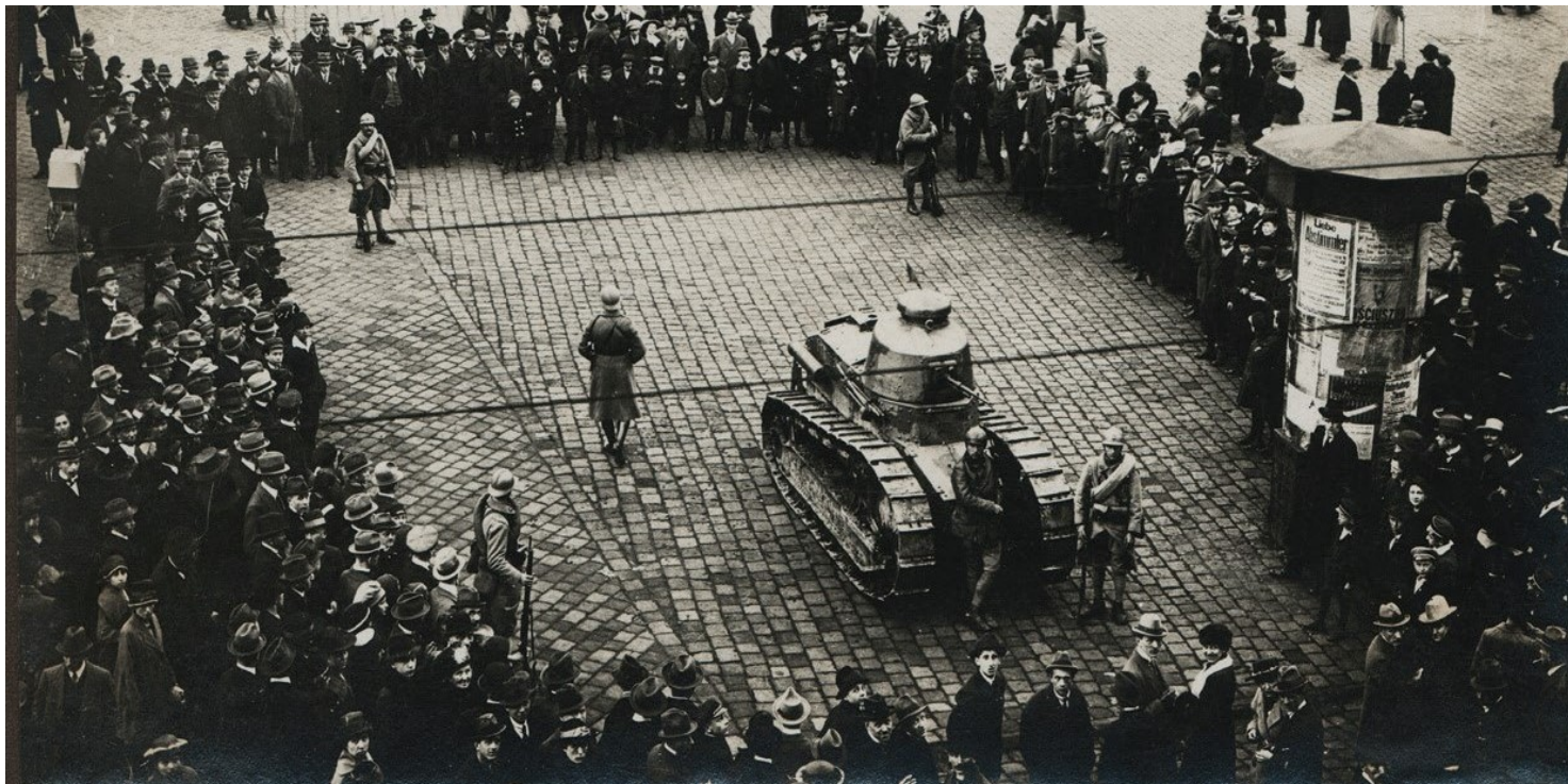
Ze zbiorów Archiwum Archidiecezjalnego w Katowicach

https://przystanekhistoria.pl/pa2/tematy/plebiscyty-terytorialne/91532,Plebiscyt-i-III-Powstanie-Slaskie-1921-roku.html