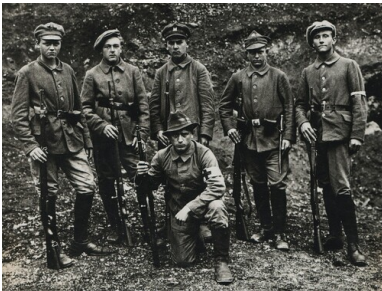
Grupa powstańców śląskich, 1921 r.

W momencie szczytowych sukcesów militarnych strony polskiej Korfanty zaczął, zgodnie z koncepcją „demonstracji zbrojnej”, dążyć do zakończenia powstania. Nawiązał z aliantami rozmowy w sprawie zawieszenia broni. Negocjacje prowadzone w Dąbrówce Małej z gen. Le Rondem doprowadziły do podpisania rozejmu 9 maja 1921 r. Wobec protestów rządu niemieckiego nie wszedł on jednak w życie. Rozejm przyniósł natomiast pewne rozprężenie w oddziałach insurekcyjnych i zahamowanie dalszej ofensywy. Powstańcy przystąpili do umacniania się na zajętych pozycjach, a wielu z nich wróciło do domów, sądząc, że zryw dobiegł końca. Z kolei strona niemiecka nie była jeszcze gotowa do podjęcia kontruderzenia. W związku z tym linia frontu uległa na pewien czas stabilizacji. Nie oznacza to, że walki całkowicie wygasły. Większe starcia miały miejsce pod Olesnem, Chudobą, Gorzowem Śląskim, Zakrzowem Turawskim, Zębownicami i Gogolinem. Tymczasem Niemcy przygotowywali się do kontrofensywy. 20 maja 1921 r. dowództwo nad całością oddziałów SSOS przejął gen. Karl Hoefler, który zreorganizował siły niemieckie w dwie grupy operacyjne: Grupę „Północ” i Grupę „Południe”. Następnego dnia Selbstschutz przystąpił do akcji w rejonie Góry św. Anny.