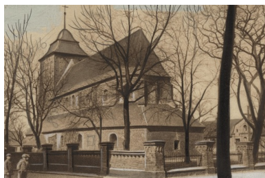
Kościół parafialny pw. Wniebowzięcia NMP i św. Stanisława BM we Wrześni. Fot. z ok. lat 20. XX w. ze zbiorów NAC

„Bracia rodacy dnia 5 marca minęła rocznica śmierci kata polskich oficerów zamordowanych w Katyniu. Zastępcą jego jest Malenkow. Podziemie”.