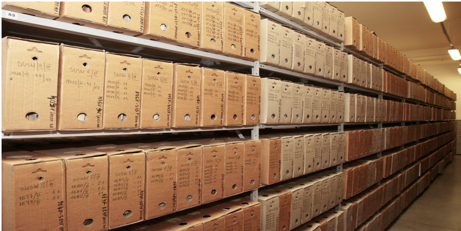
Magazyn archiwalny AIPN.

https://przystanekhistoria.pl/pa2/tematy/podziemie-antykomunisty/100669,Biali-Banici-z-Wrześni-kontra-Gieorgij-Malenkow.html